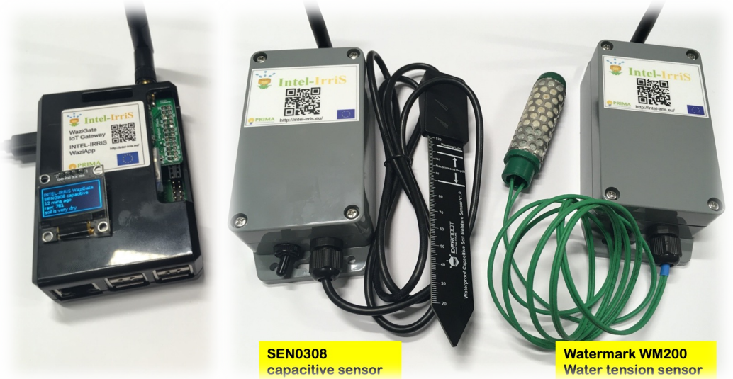
SEN0308 capacitive sensor

VISUALISER LA DERNIÈRE VALEUR REÇUE ET L'ÉTAT HYDRIQUE DU SOL