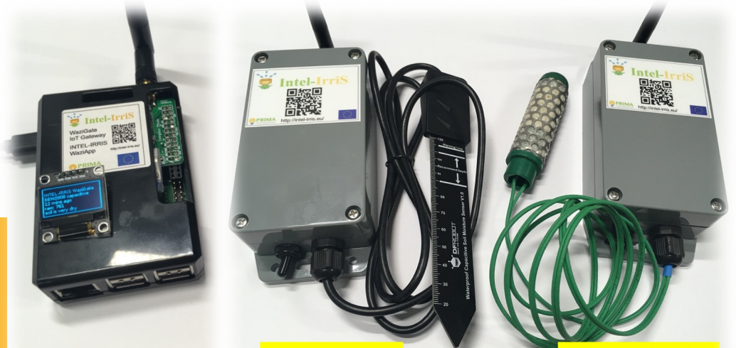
SEN0308 capacitive sensor

Flashez le QR code du WiFi affiché sur l'écran de la WaziGate